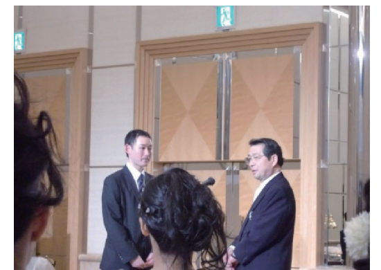
卒業生代表に記念品を贈呈する社会長

この会の中で、大阪物療大学の大学OB会が結成されました。当面は当会もOB会と共催できる企画を行いたいと考えます。